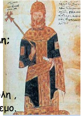
1. Ο Μιχαήλ Η', ο Παλαιολόγος, στέφθηκε αυτοκράτορας και στην Αγία Σοφία.

Η Κωνσταντινούπολη έμεινε χωρίς συμμάχους και οι εχθροί ήταν πολλοί. Στην Ανατολή παραμόνευαν τα τουρκικά φύλα, στο Βορρά απειλούσαν οι Σέρβοι και οι Βούλγαροι, στη δύση οι Φράγκοι και οι Βενετοί. Όλα φανέρωναν πως η αυτοκρατορία οδηγούνταν προς την τελική πτώση.