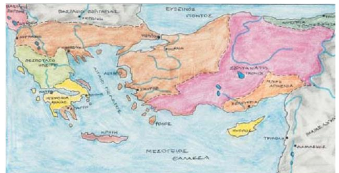
6. Η Βυζαντινή αυτοκρατορία μετά την ανάκτηση της Κωνσταντινούπολης. Με κίτρινο χρώμα σημειώνονται τα λατινικά κράτη που δημιουργήθηκαν μετά τη Δ' Σταυροφορία.