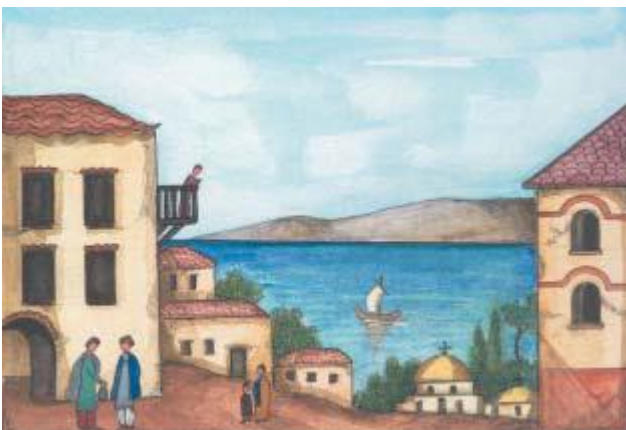
Γειτονιά της Πόλης

Την επίβλεψη της αγοράς είχε ο Έπαρχος της Πόλης , ο οποίος ενημερωνόταν τακτικά για την επάρκεια των αγαθών και τις τιμές τους, δίνοντας ιδιαίτερη προσοχή για τα είδη πρώτης ανάγκης.